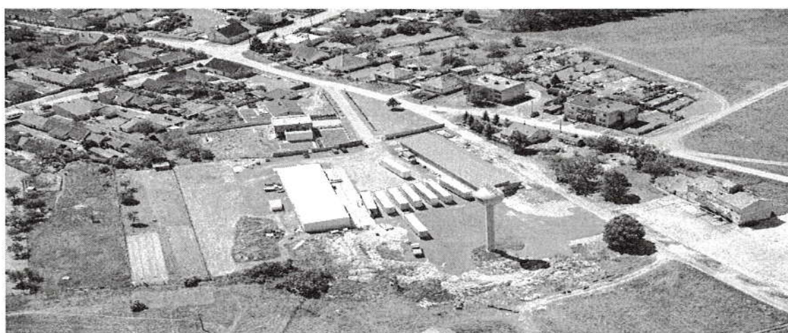
V obci pôsobí rovnako niekoľko fyzických živnostníkov a samostatne hospodáriacich roľníkov.